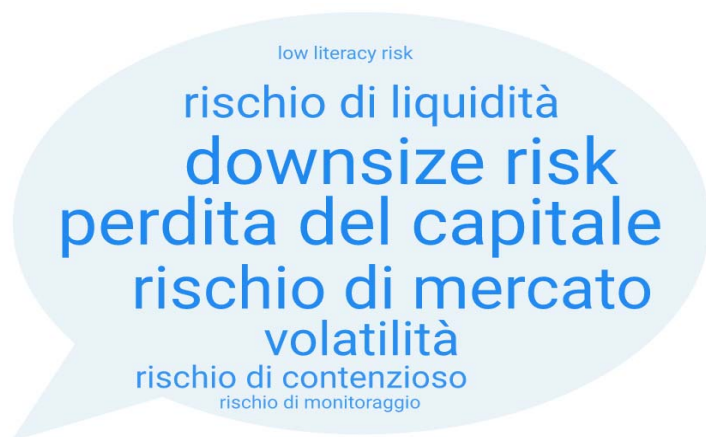
Fig. 2 – Cosa le suggerisce l'espressione 'rischio finanziario'?

Fonte: elaborazione degli autori sulla base delle risposte che i partecipanti all'indagine hanno indicato scegliendo tra le seguenti alternative: elevata esposizione all'andamento generale del mercato (rischio di mercato); possibilità di perdere tutto o parte del capitale investito (perdita del capitale); possibilità di non essere in grado di disinvestire o di doverlo fare a condizioni sfavorevoli in caso di necessità (rischio di liquidità); possibilità di ottenere un risultato inferiore alle attese ( downsize risk ); possibilità di rimanere vittima di comportamenti scorretti dell'intermediario proponente (rischio di contenzioso); possibilità di non aver compreso perfettamente le caratteristiche del prodotto ( low literacy risk ); possibilità di non essere in grado di seguire l'andamento dell'investimento (rischio di monitoraggio); possibilità che le tutele previste dalla regolamentazione non siano sufficienti; possibilità che le procedure per un eventuale risarcimento danni siano costose e inefficaci (rischio di contenzioso).