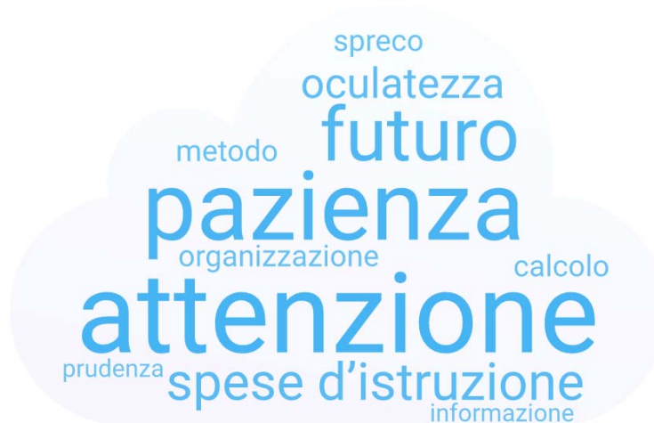
Fig. 3 – Cosa le suggerisce l'espressione 'gestione del bilancio familiare'?